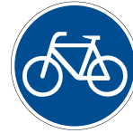
Radweg Dieser Weg ist nur für Radfahrende bestimmt.

Grundsätzlich dürfen Radfahrende wählen, ob sie die Fahrbahn oder den Radweg benutzen möchten. Ist der Radweg jedoch mit einem der folgenden Verkehrszeichen versehen, muss dieser benutzt werden: