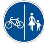
Getrennter Geh- und Radweg Fuß- und Radweg müssen getrennt benutzt werden.